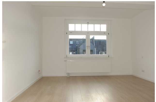
FE 19, WE 7,1_DG, Schlafen