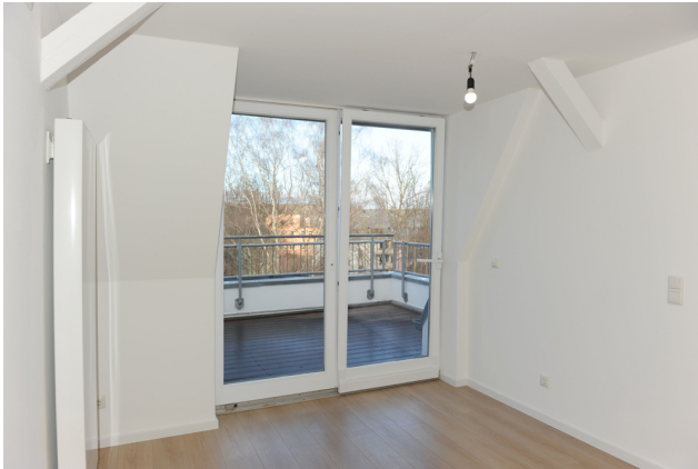
FE 19, WE 7,1_DG, Wohnen 3