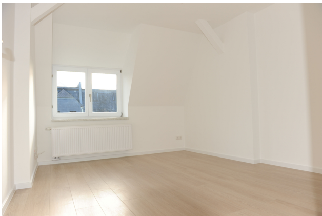
FE 19, WE 7,1_DG, Kind,Arbeiten