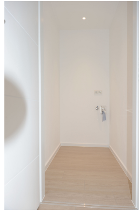
FE 19, WE 7,1_DG, WM_Raum