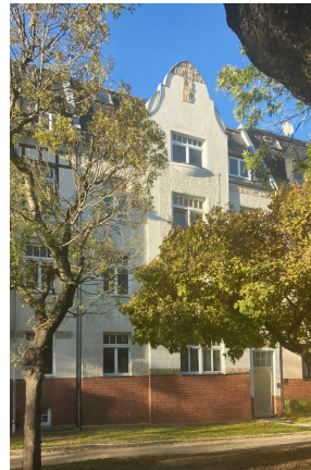
Friedrich-Engels-Strasse 19, Vorderfassade 2