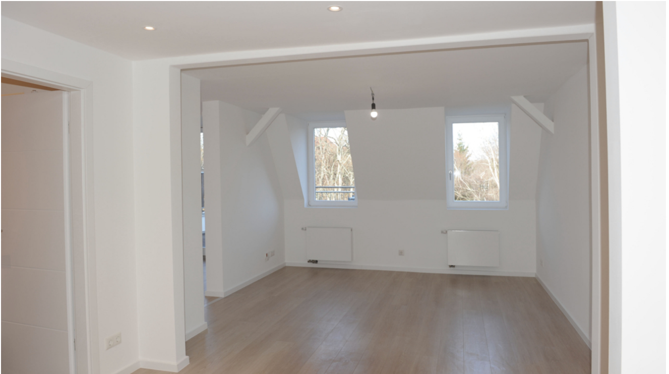
FE 19, WE 7,1_DG, Wohnen 5