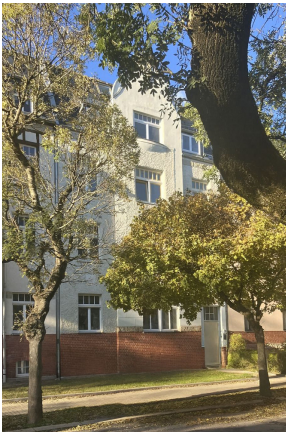
Friedrich-Engels-Strasse 19, Vorderfassade 1