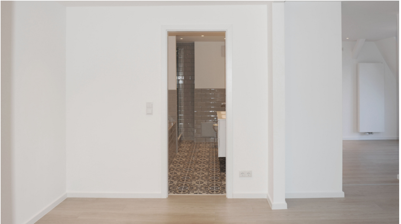
FE 19, WE 7,1_DG, Wohnen 2