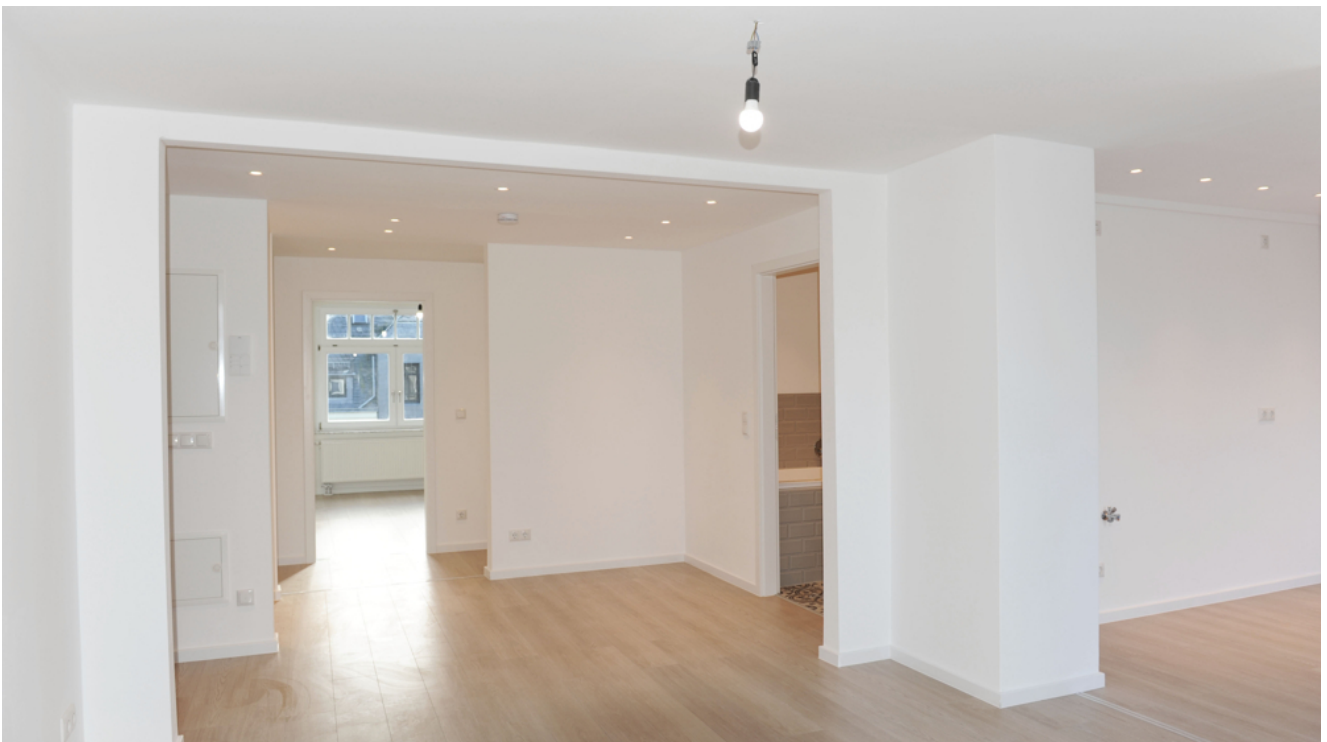
FE 19, WE 7,1_DG, Wohnen 1