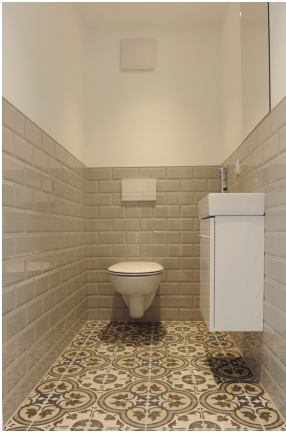
FE 19, WE 7,1_DG, WC