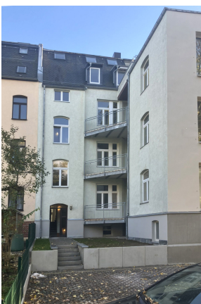
Friedrich-Engels-Strasse 19, Rückfassade 1