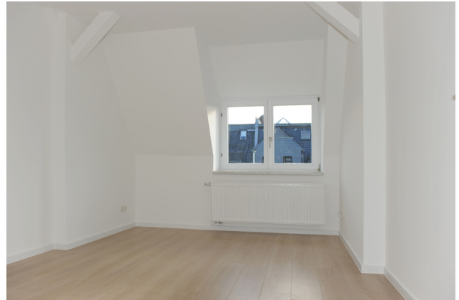
FE 19, WE 7,1_DG, Kind,Arbeiten 2