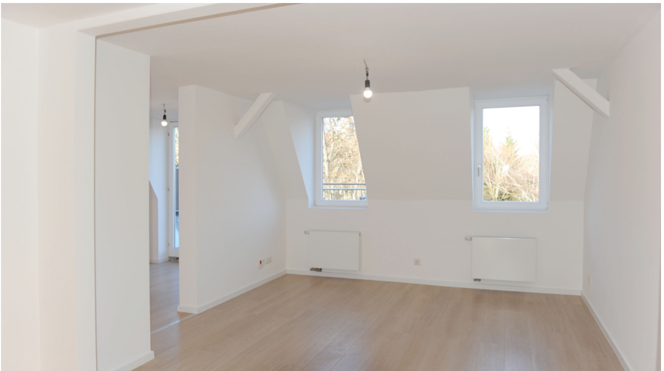
FE 19, WE 7,1_DG, Wohnen 4