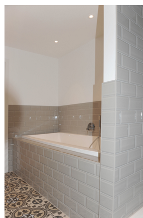
FE 19, WE 7,1_DG, Bad 3