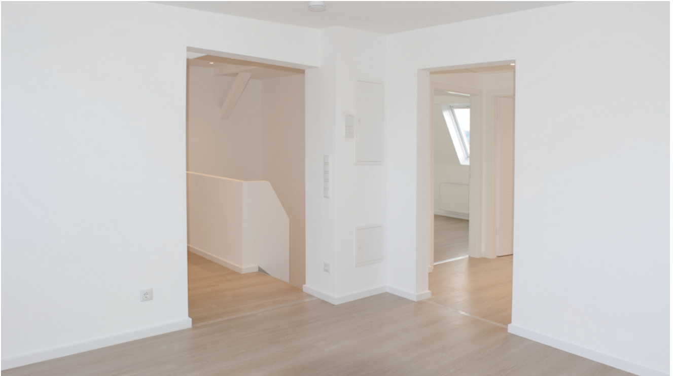
FE 19, WE 8, Wohnen 4