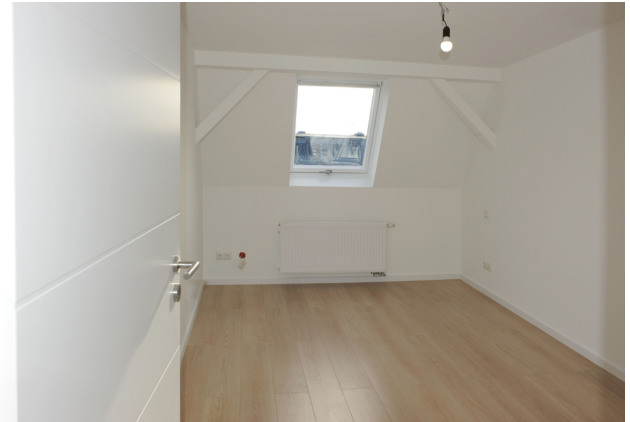
FE 19, WE 8, Schlafen