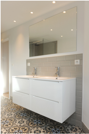
FE 19, WE 8, Bad 2