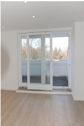
FE 19, WE 8, Wohnen 5