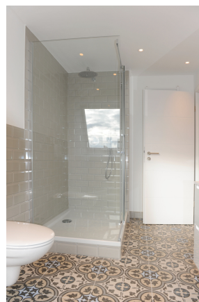
FE 19, WE 8, Bad 1