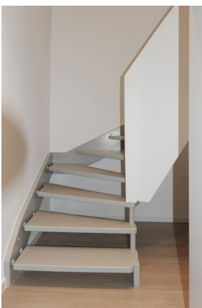
FE 19, WE 8, Antritt Treppe