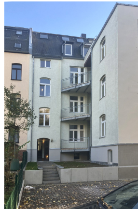
Friedrich-Engels-Strasse 19, Rückfassade 1