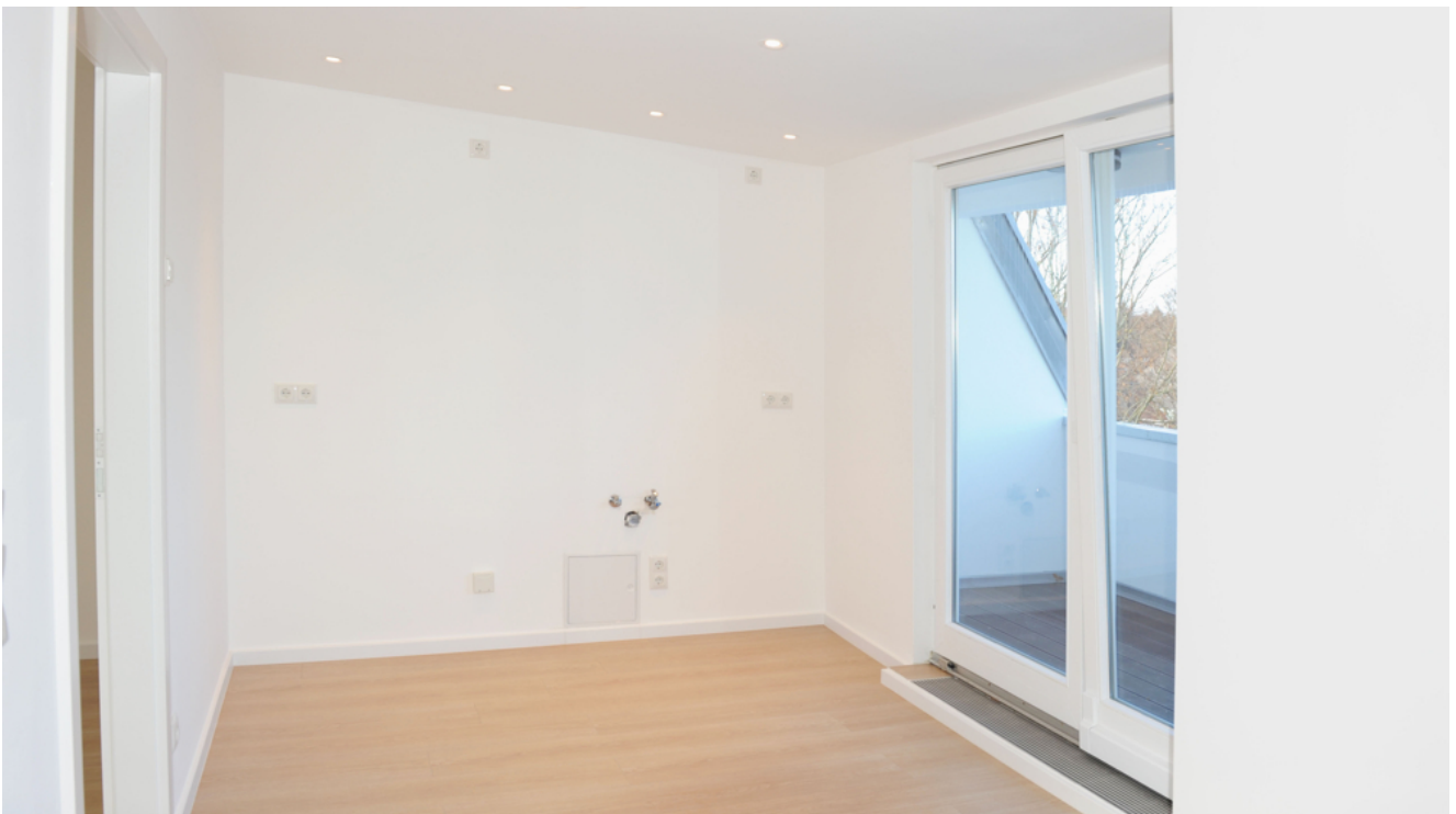
FE 19, WE 8, Wohnen 2