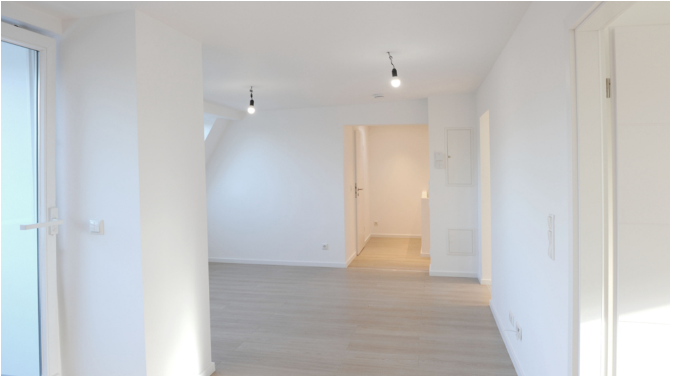
FE 19, WE 8, Wohnen 3