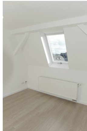
FE 19, WE 8, Kind