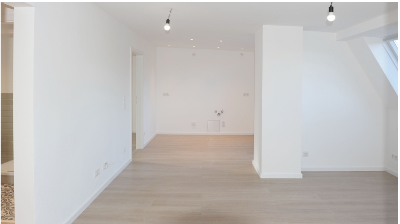
FE 19, WE 8, Wohnen 1