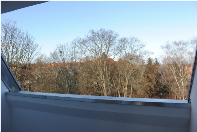
FE 19, WE 8, Loggia