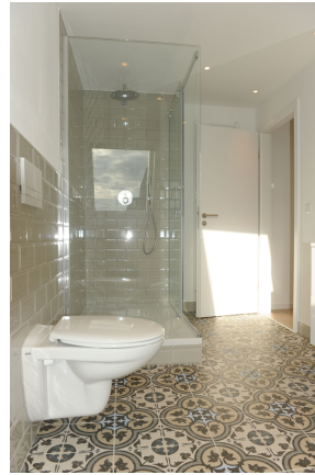
FE 19, WE 8, Bad 3