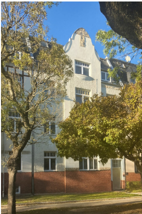
Friedrich-Engels-Strasse 19, Vorderfassade 2