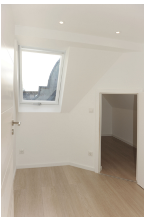
FE 19, WE 8, WM Raum