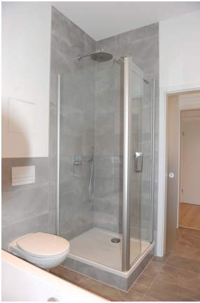
Leipziger 100, 1_OG, WE 3, Bad 1