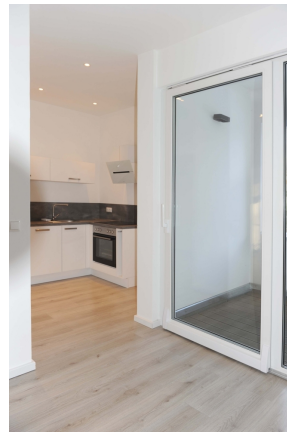
Leipziger 100, 1_OG, WE 3, EBK 2