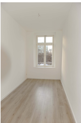
Leipziger 100, 1_OG, WE 3, Kind 1