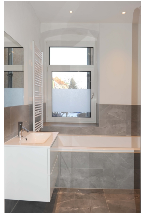
Leipziger 100, 1_OG, WE 3, Bad 2