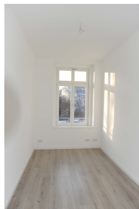
Leipziger 100, 1_OG, WE 3, Kind 2