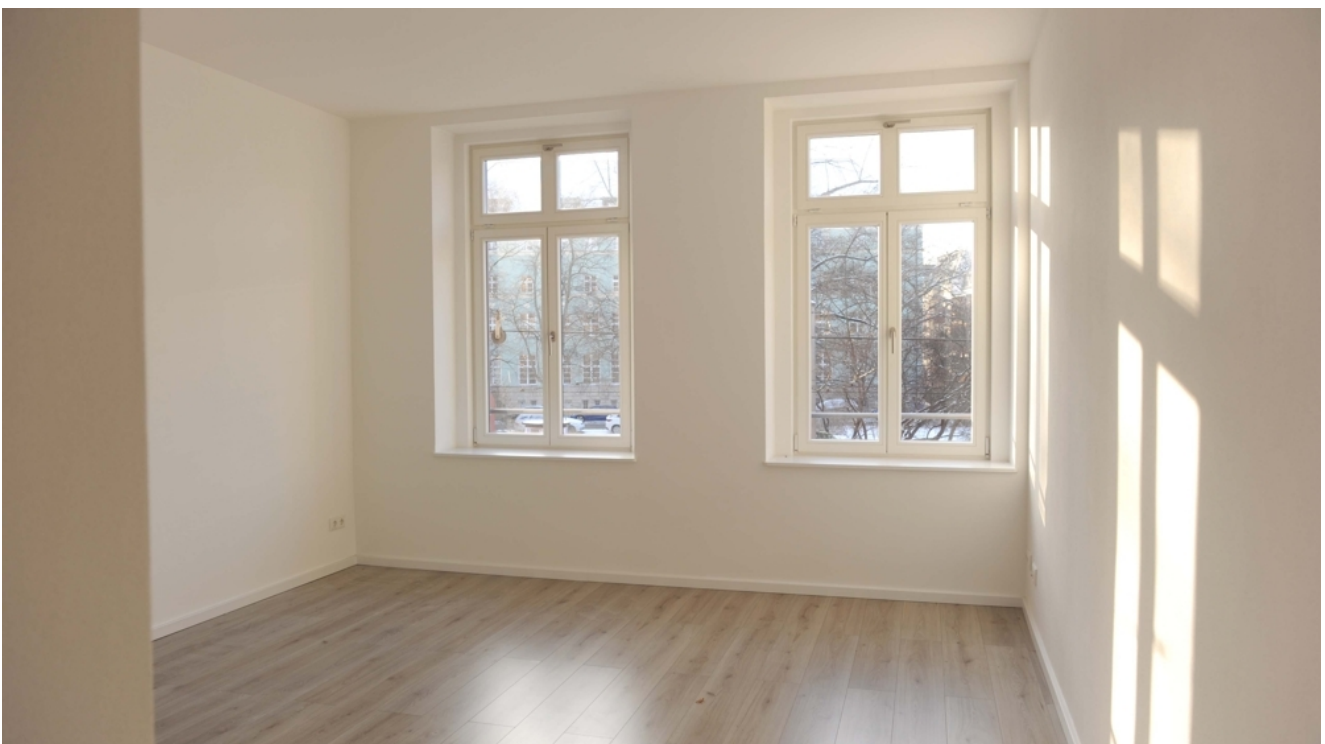
Leipziger 100, 1_OG, WE 3, Wohnen 1