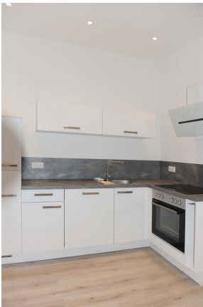
Leipziger 100, 1_OG, WE 3, EBK 3