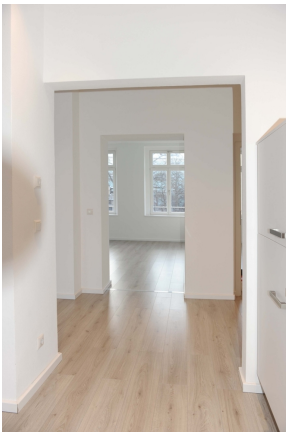
Leipziger 100, 1_OG, WE 3, Küche, Wohnen