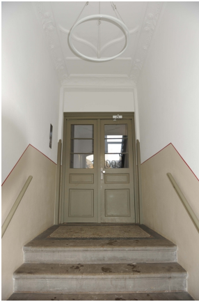
Leipziger 100, 1_OG, WE 3, Eingang