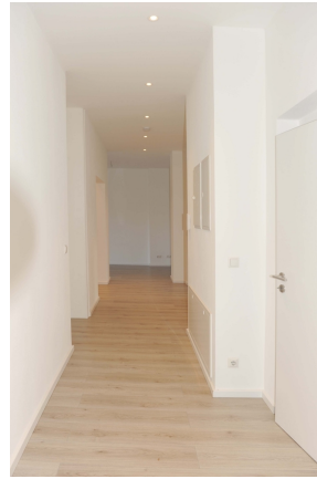
Leipziger 100, 1_OG, WE 3, Flur 1