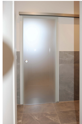
Leipziger 100, 1_OG, WE 3, WC Glastür