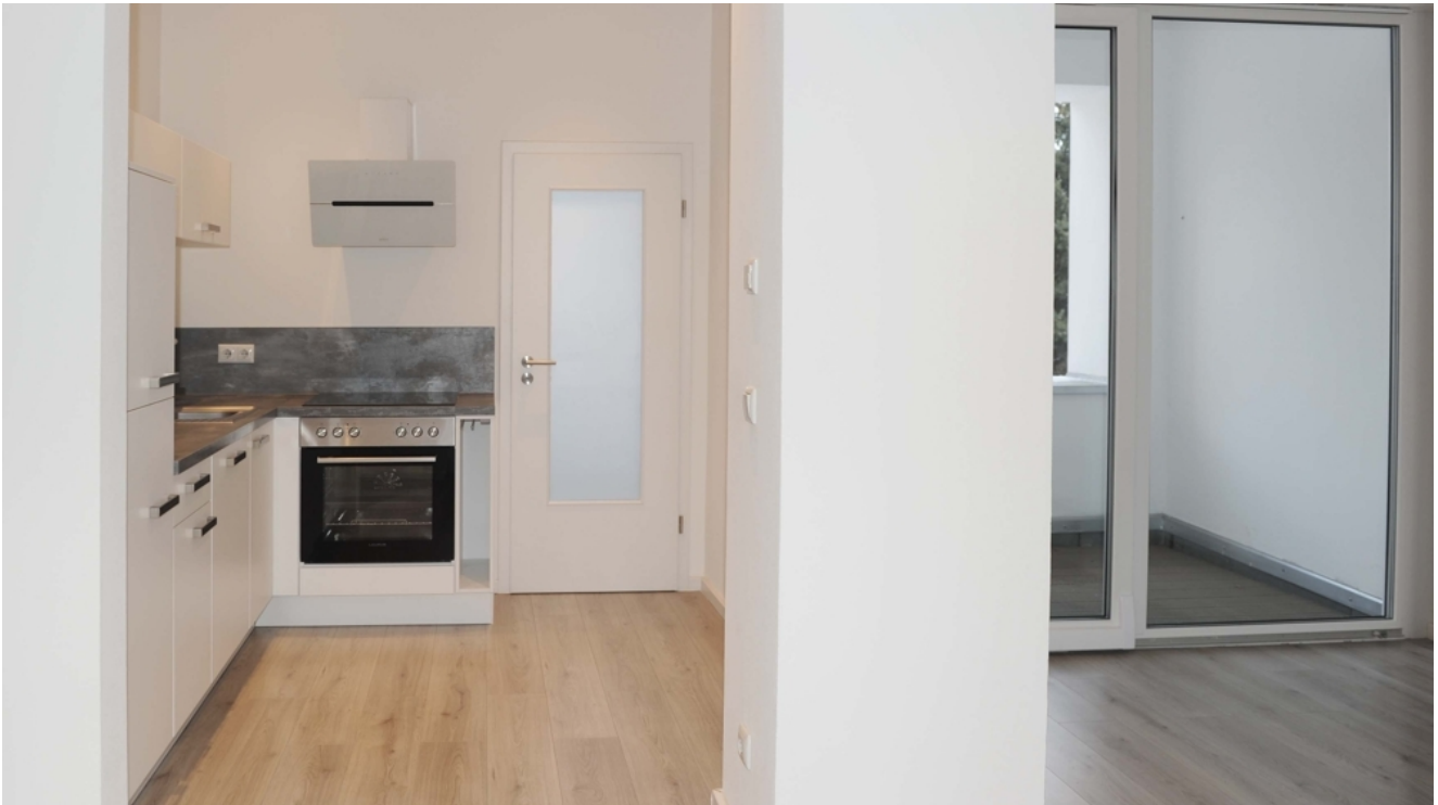
Leipziger 100, 1_OG, WE 3, EBK 1