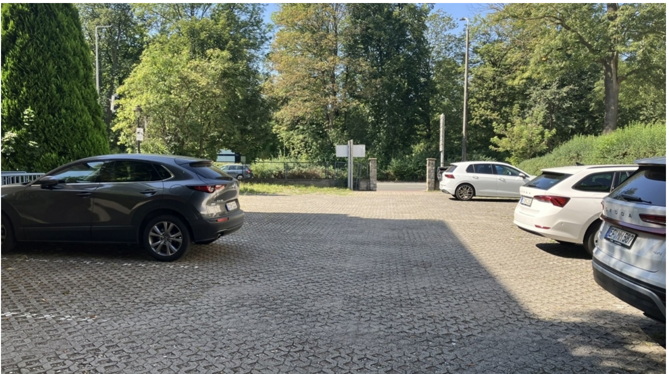
Am Schwanenteich 4, Stellplätze