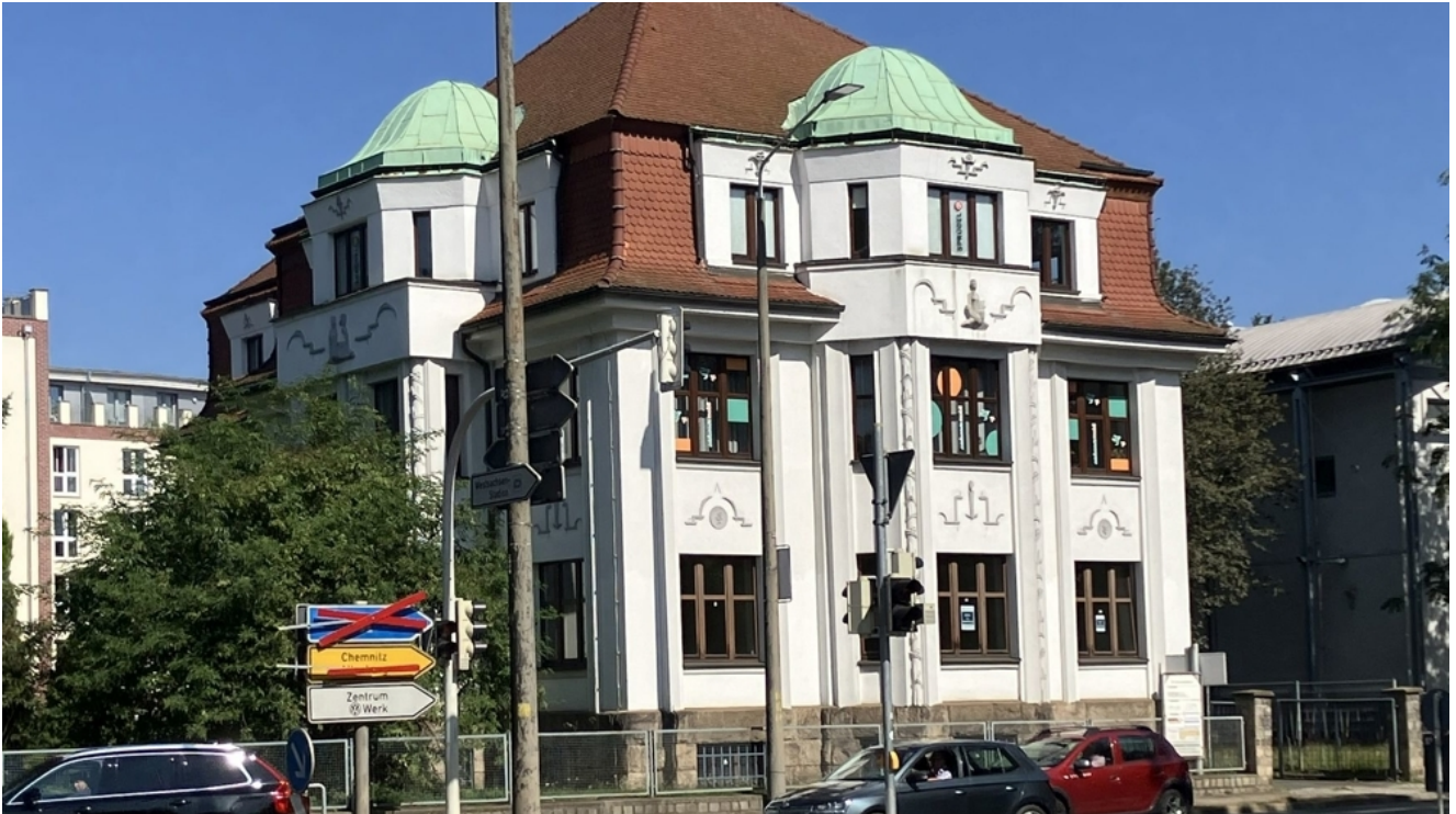
Am Schwanenteich 4, Ansicht 2