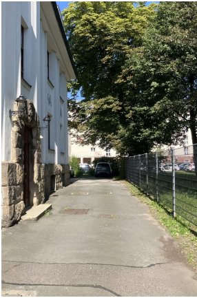
Am Schwanenteich 4, Zufahrt