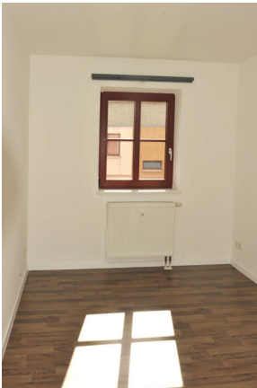
ISS 15, WE 4, Schlafen 1.png