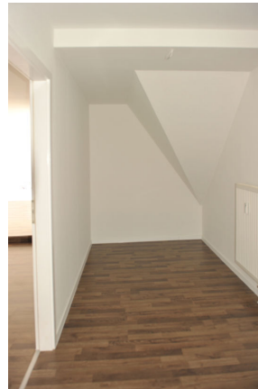
ISS 15, WE 4, Flur.png