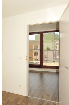
ISS 15, WE 4, Loggia 1.png