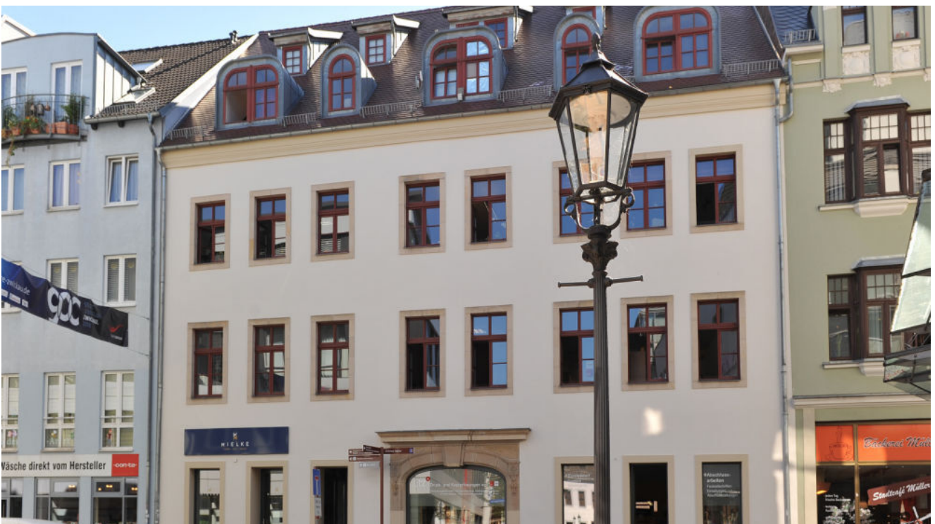
ISS 15, neu 2018.png