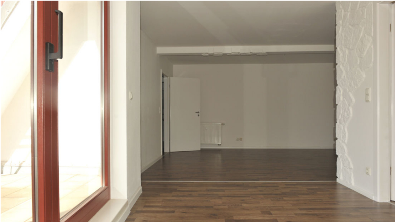
ISS 15, WE 4, Wohnen 4.png