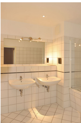
ISS 15, WE 4, Bad 1.png