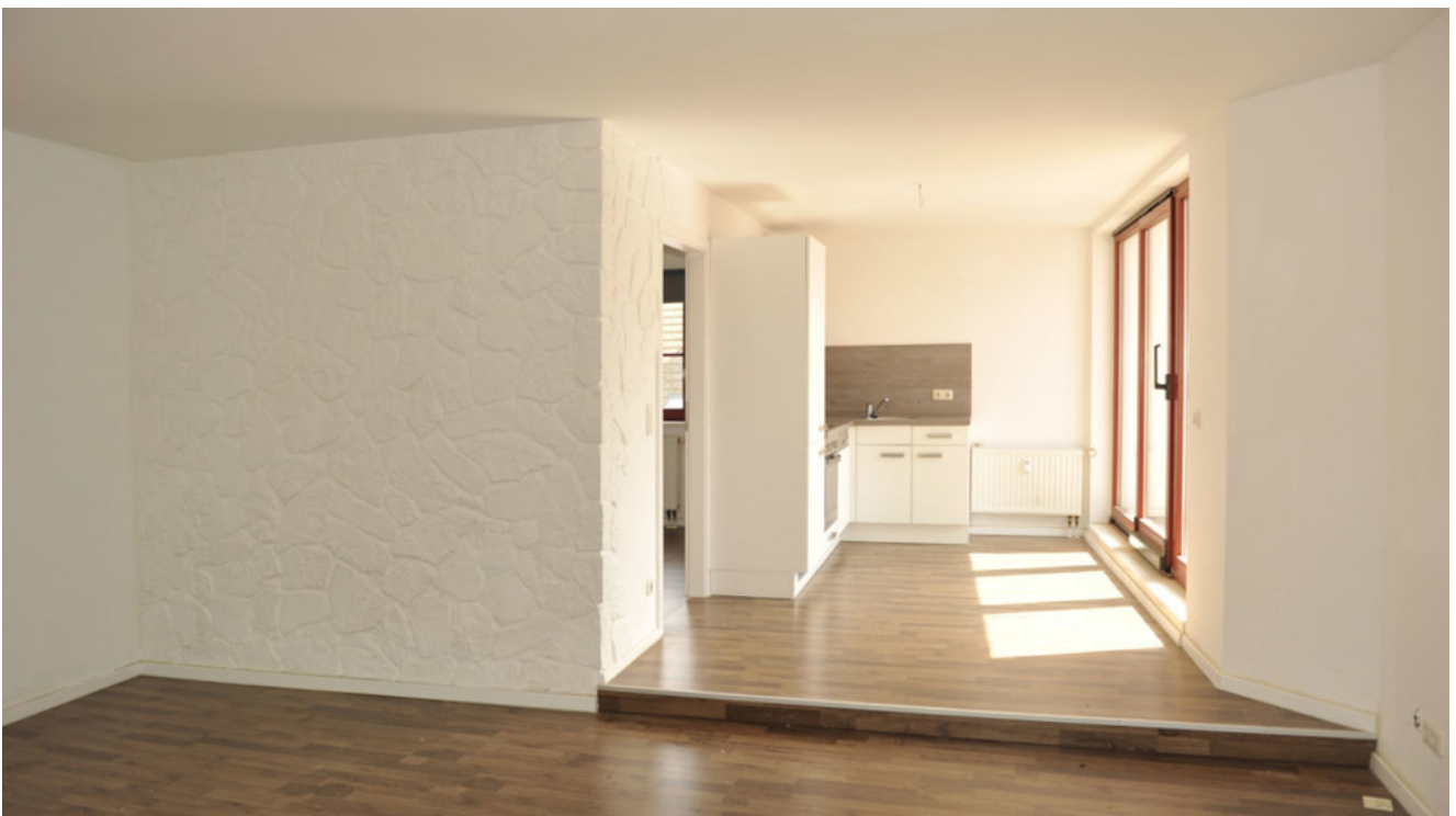
ISS 15, WE 4, Wohnen.png