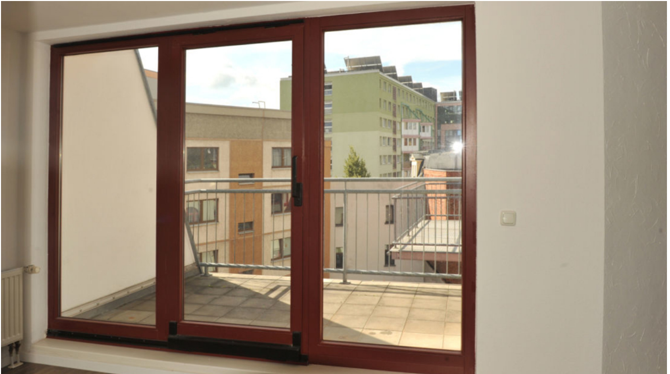
ISS 15, WE 4, Loggia 2.png