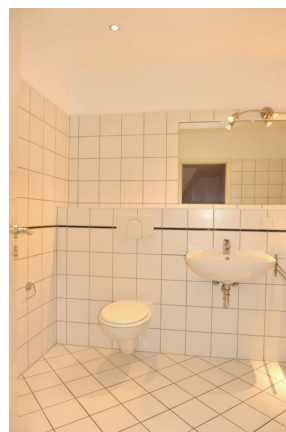
ISS 15, WE 4, Bad 2.png