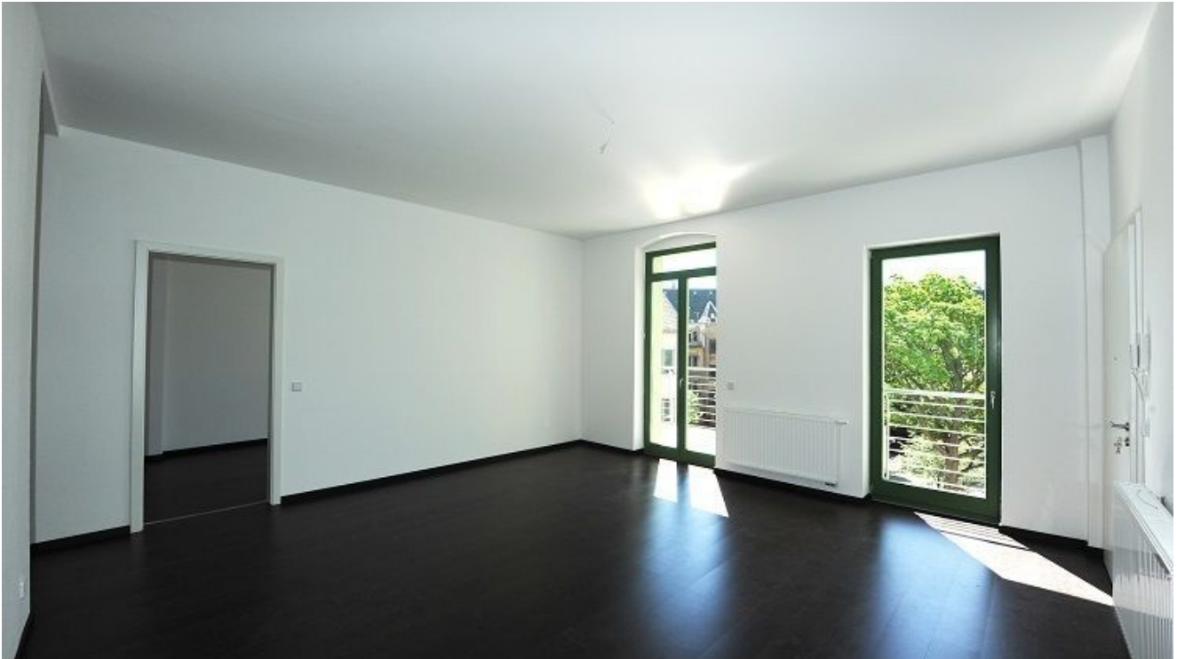
Äußere Plauensche Straße 17, W.png