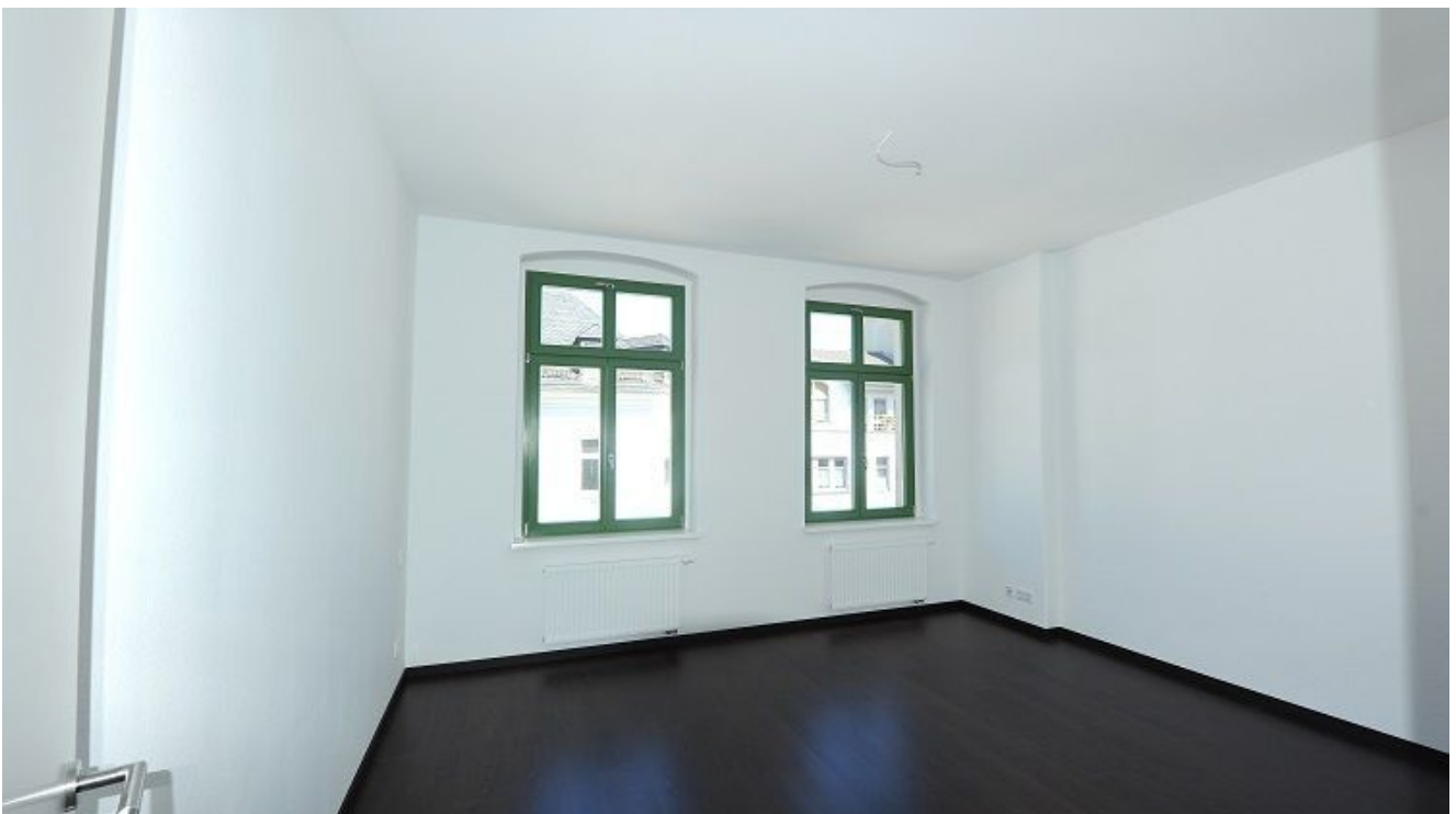
Äußere Plauensche Straße 17, W.png