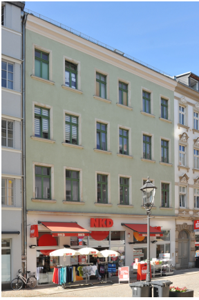
Äußere Plaunsche 17, fertig