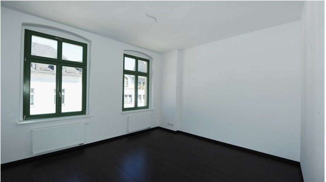
Äußere Plauensche Straße 17,.png